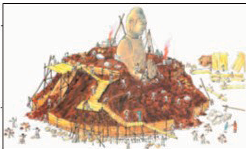
「大仏の鋳造後の調整作業の図 （『ならの大仏さま』加古里子絵）」