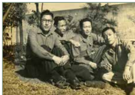
写真左より、①泰緬鉄道建設現場で強制労働させられる捕虜たち、②1947年にBC級戦犯として処刑された朝鮮人軍属・趙文相(チョウムンサン、日本名:平原守矩)、③スガモプリズンで服役中の朝鮮人戦犯者たち