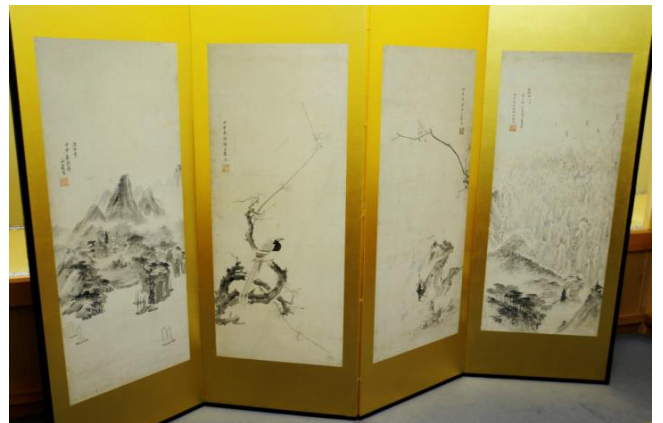
洛山寺(ナクサンサ)屏風 静岡市興津 清見寺蔵 第11回朝鮮通信使に随行してきた画員・金有声(キムウソン)が、清見寺に似ているとして描いた洛山寺